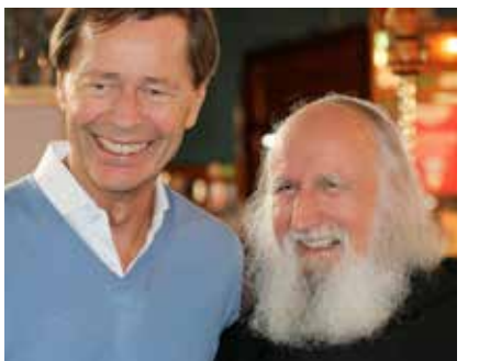
Dr. Thomas Middelhoff und Pater Dr. Anselm Grün im Lesezelt - ökum. Veranstaltung von KM. & VEB mit