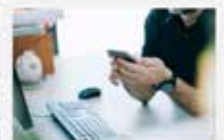
Direktabruf Gelbe Beilage