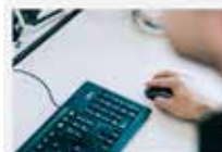
Setzung Gelbe Beilage für die Warenwirtschaft