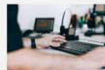
Anmeldung Erinnerungsdienst Gelbe Beilage