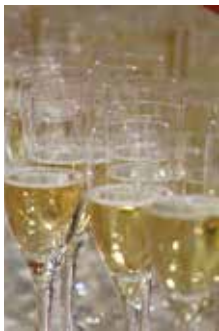
Zeit für Begegnung und Austausch