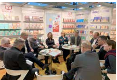
Sitzung der ehemaligen CMF-Gesellschafter